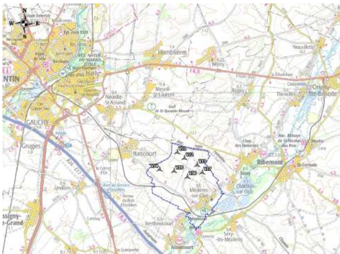
Localisation du projet

L'avis est rendu sur un projet d'extension de sept éoliennes d'une hauteur de 199,5 m et de garde au sol de 36,5 mètres, localisées comme indiqué ci-dessous.